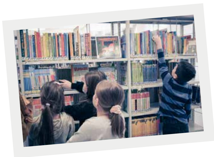
1. Klasse aus dem Schulhaus Barblan

SCHULBIBLIOTHEK STADTBIBLIOTHEK CHUR – JAHRESBERICHT 2021