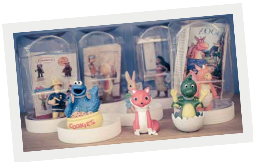
Neu im Bestand: Tonies

Die beliebten Tonies im Design der jeweiligen Hörspiele und der Lesebär SAMi bereichern seit 2021 unser Sortiment. Die Hörfiguren für Kinder erzählen Geschichten, vermitteln Wissenswertes oder spielen Musik. Die Nachfrage ist enorm, die Regale sind immer wieder leergeräumt.