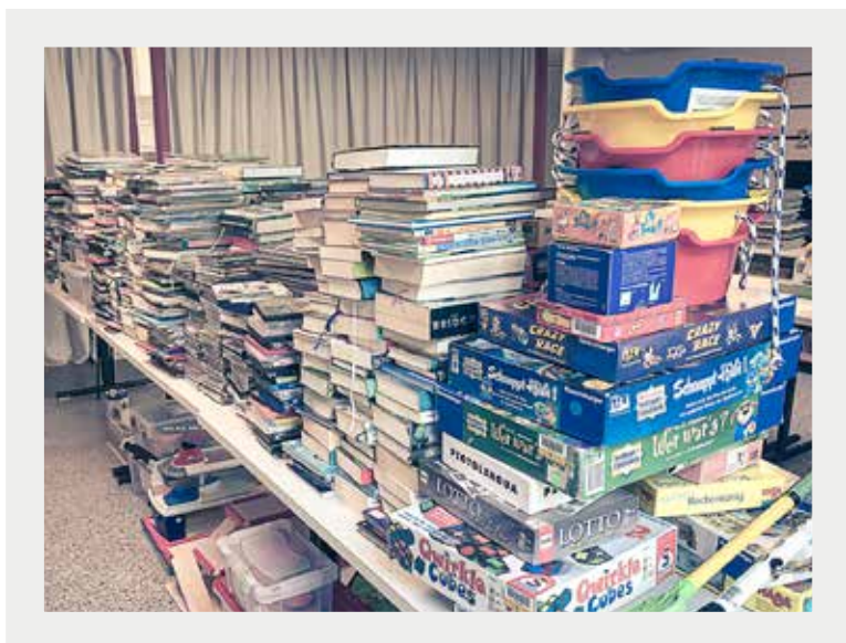
Medien in Quarantäne